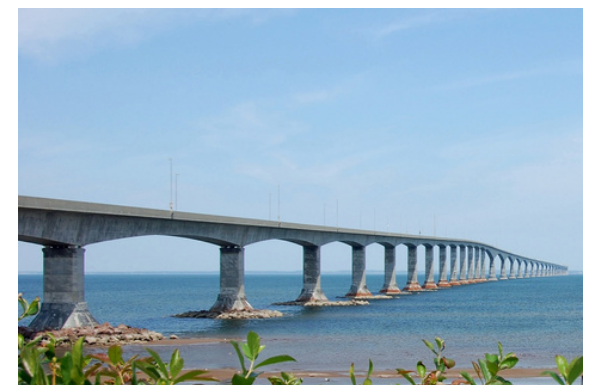
Pont de la Confédération