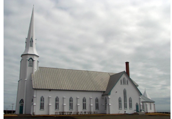
Église St-Pierre de Lavernière